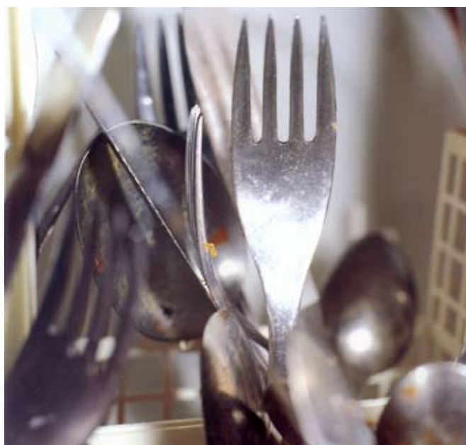
Yves Trémorin, nature morte n°14 , photographie, 1993.