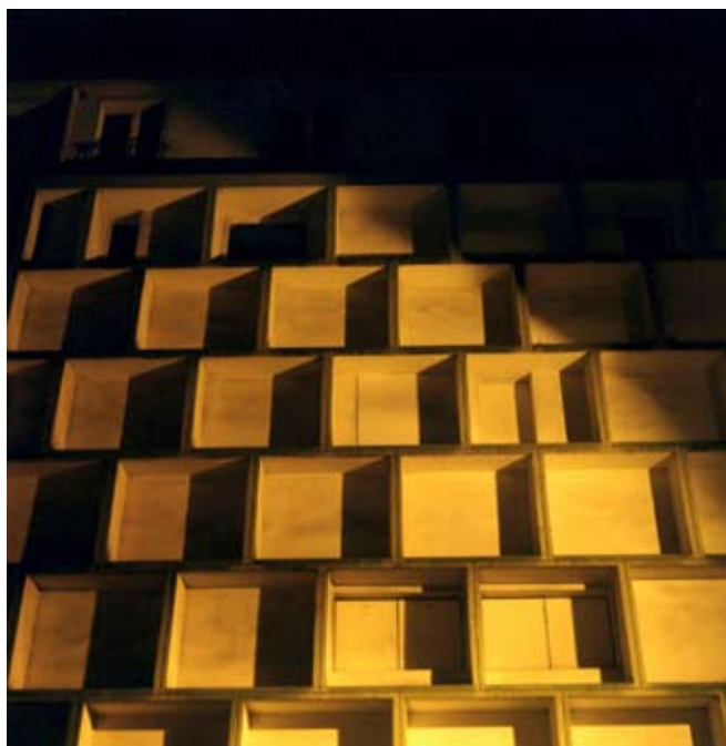
David Barriet, Patrimoine , photographie, 2006.

(Les artistes et les œuvres cités ci-dessous sont présents et disponibles à l'emprunt dans la collection de l'Artothèque)