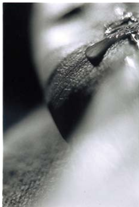
Olivier Umhauer, sans titre , photographie, 1993.