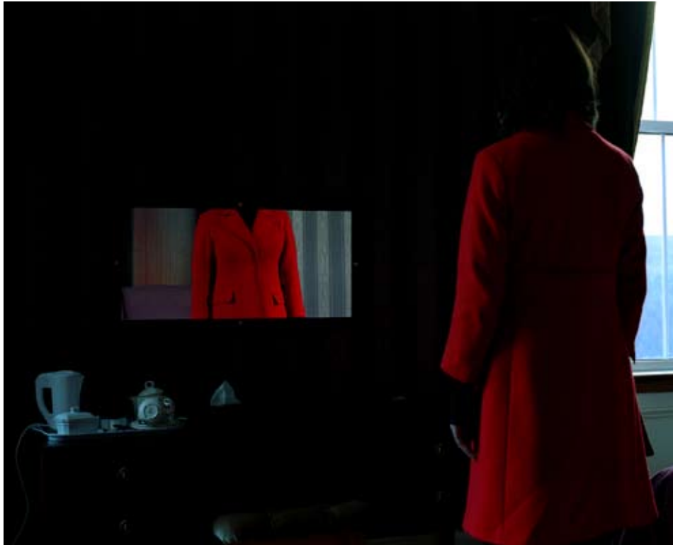
© Astrid Kruse Jensen, Hotel Room , photographie