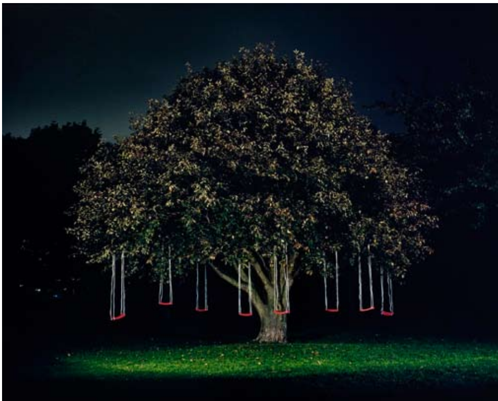
© Astrid Kruse Jensen, Constructing a memory , photographie

Degree Show, Glasgow School of Art, Royaume-Uni