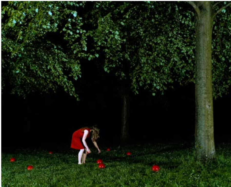
© Astrid Kruse Jensen, A place she had always dreamt about , photographie

Le paradoxe du travail d'Astrid Kruse Jensen réside dans la volonté de faire cohabiter réalité et imaginaire à travers le médium photographique. Elle utilise la photographie comme outil pour créer des histoires. Son travail traite de prime abord de sujets ordinaires, mais ces images suggèrent plus qu'elles ne montrent, laissant ainsi une part d'interprétation au spectateur.