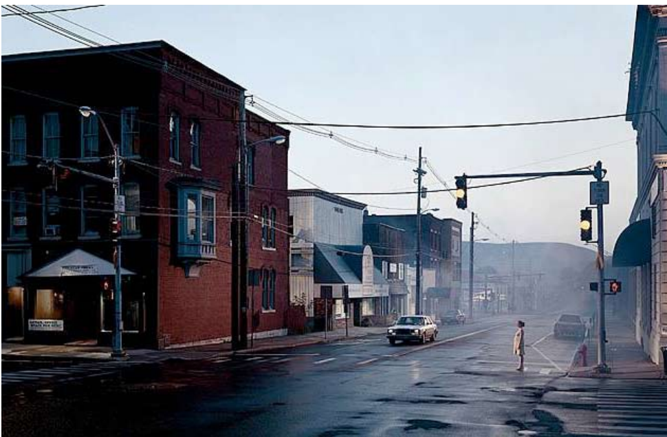
Gregory Crewdson, Untitled , photographie extraite de la série 'Beneath the Roses', 2005.